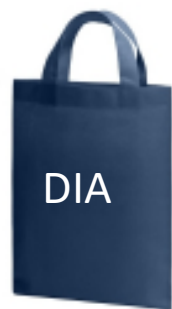
※写真はイメージです。 (展示企業紹介バッグ)