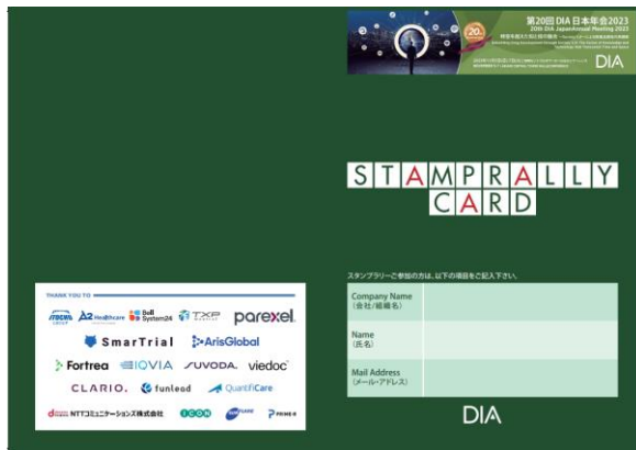
2023年スタンプラリーカード