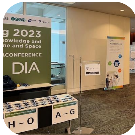
※写真は2023年の例です