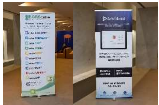
※写真は2019年の例です