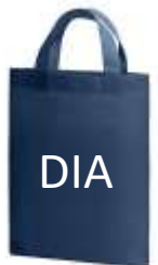
※写真はイメージです。 （展示企業紹介バック）