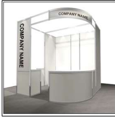
146,500 円 (税込)