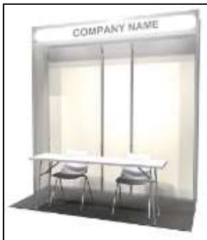
45,500 円 (税込) ライト付