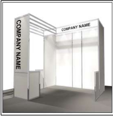
196,500 円 (税込)