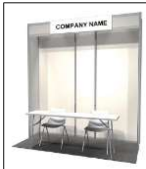
17,000 円 (税込)