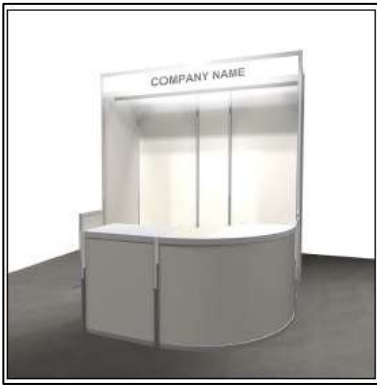
146,500 円 (税込) ライト付