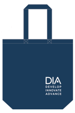
※写真はイメージです。(コングレスバッグ)