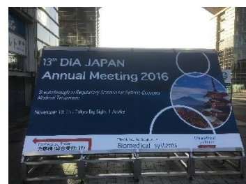
Exhibit Booth 2017