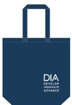
※写真はイメージです。(コングレスバッグ)