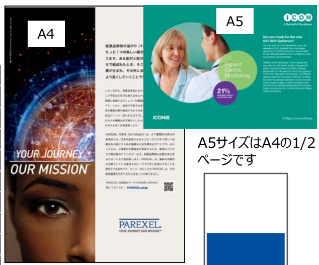
※写真は昨年の例です